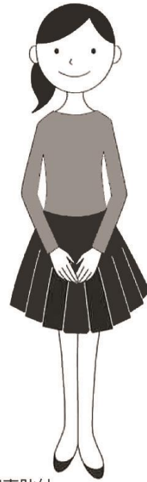
全身写真貼付 (頭からつま先まで写っているもの)